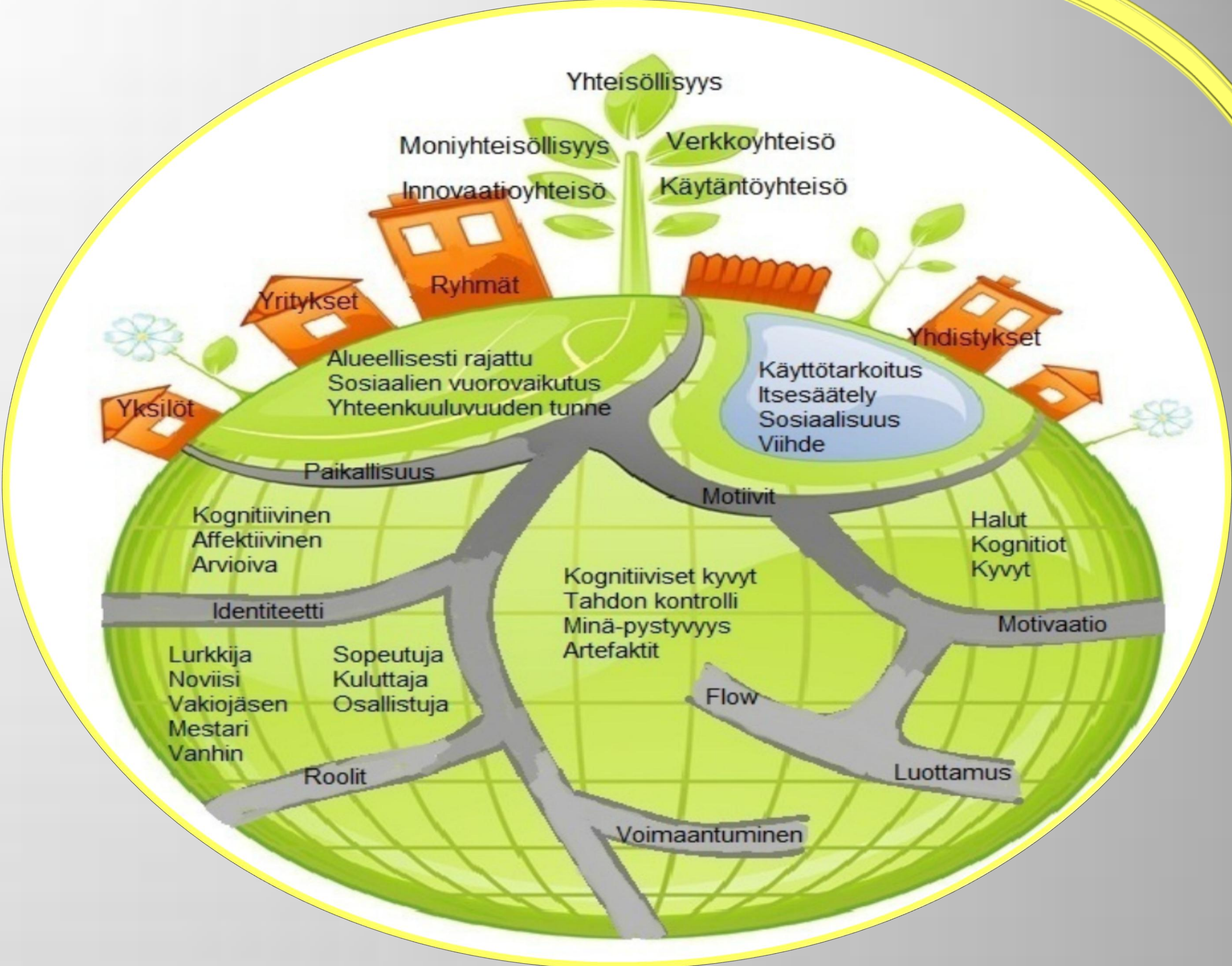
Kuva 3. Sitouttavan verkkoympäristön eri aspektit.